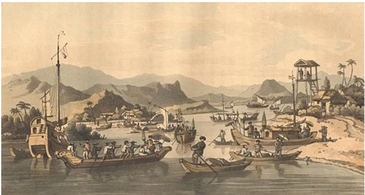
photo, les montagnes et les bateaux sur ... le gave ... de Cochinchine