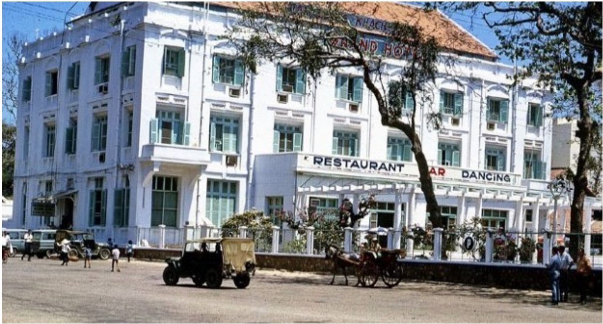
Le Grand Hôtel

Jean Charles entre à l'Ecole militaire de Saint-Cyr en 1868 et en sortira sous-lieutenant. Puis lieutenant en 1873, il sera affecté en Cochinchine en tant qu'administrateur, chevalier de la Légion d'Honneur et chargé des Affaires indigènes. Il sera cité en 1896 en tant que qu'administrateur conseil dans une affaire touchant à la transformation d'un sanatorium en grand hôtel au Cap Saint-Jacques. Il est encore en Cochinchine en 1900, mais finira sa vie à Paris en 1906.