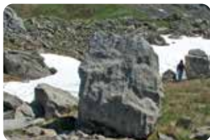
2 Borne pastorale n°1