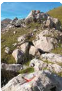
7 Borne pastorale n°6