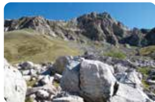
3 Borne pastorale n°2