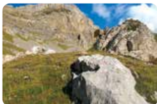
6 Borne pastorale n°5