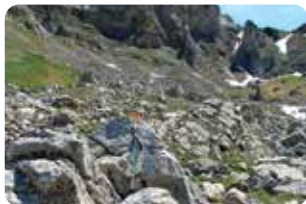
4 Borne pastorale n°3