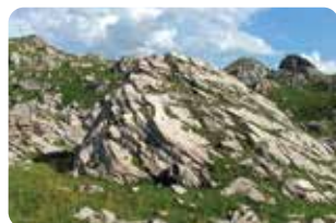
5 Borne pastorale n°4