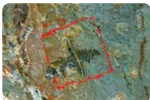
8 Borne pastorale n°7