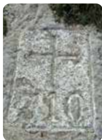
1 Borne frontière 310